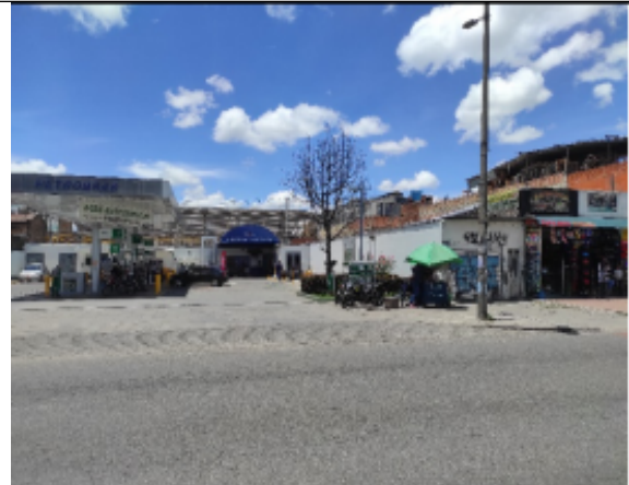
Foto 2. Se evidencia que el elemento publicitario fue desmontado del sitio inicial donde fue otorgado el registro.