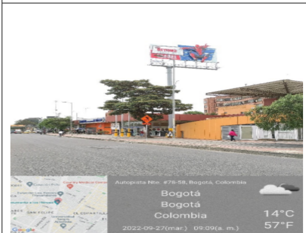
Foto 3. Vista panorámica del sitio de traslado de la valla en la Avenida 13 No. 77 - 08 (dirección solicitud), orientación SUR - NORTE