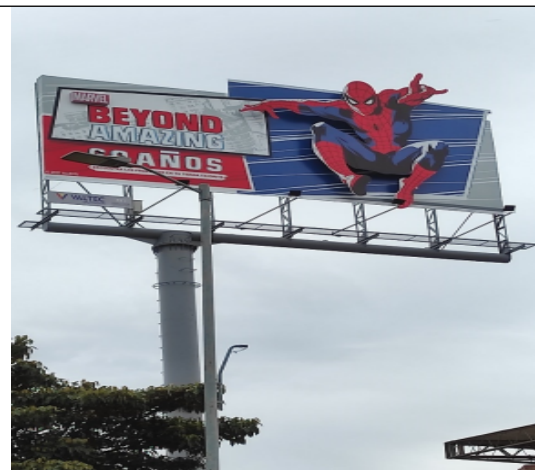
Foto 4. Vista en detalle del panel publicitario instalado.